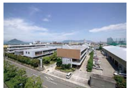
高等技術学校 高松校