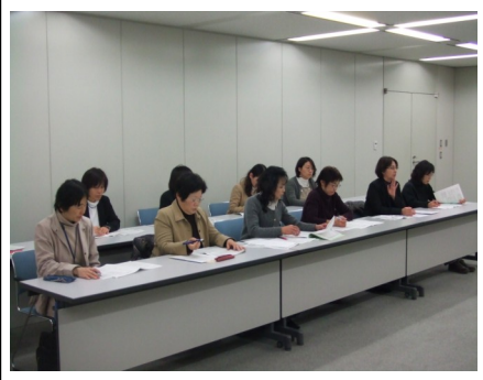
交渉する女性部・青年部