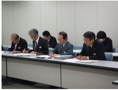
回答する県教委幹部