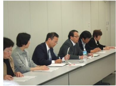
要求する香教組執行部

香教組 3年連続の月例給引き下げ。国家公務員と同じように、人動を見送り、7・8%カットが2年間実施されるような話もでてくる。県独自カットを続けるのか。 県教委 運営計画を毎年毎年見ながら検討する。悪く見れば、続くが、よく見れば1年で終わりと考えることもできる。 香教組 みなさん（県教委）とも要求は一致するでしょう。 教育長 その通り。教員だけカットしなくても批判するものはいない。（交渉の一週間後、カット提案が出された）